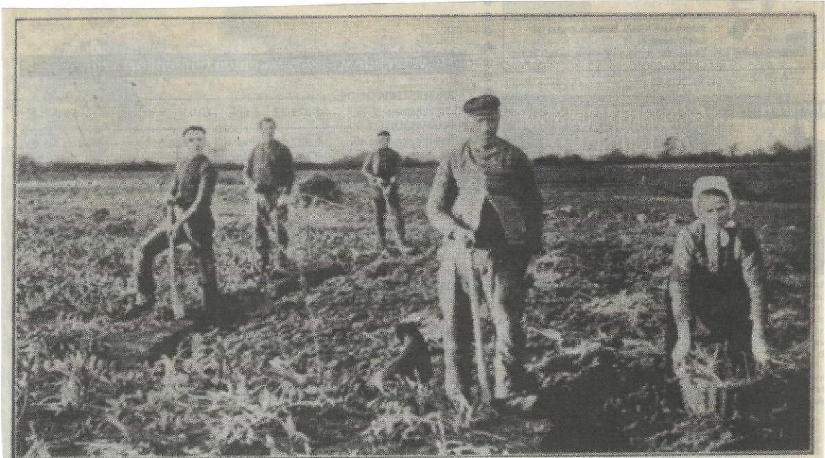
Cichorei-'dollen' bij Twijzelerheide (1907).