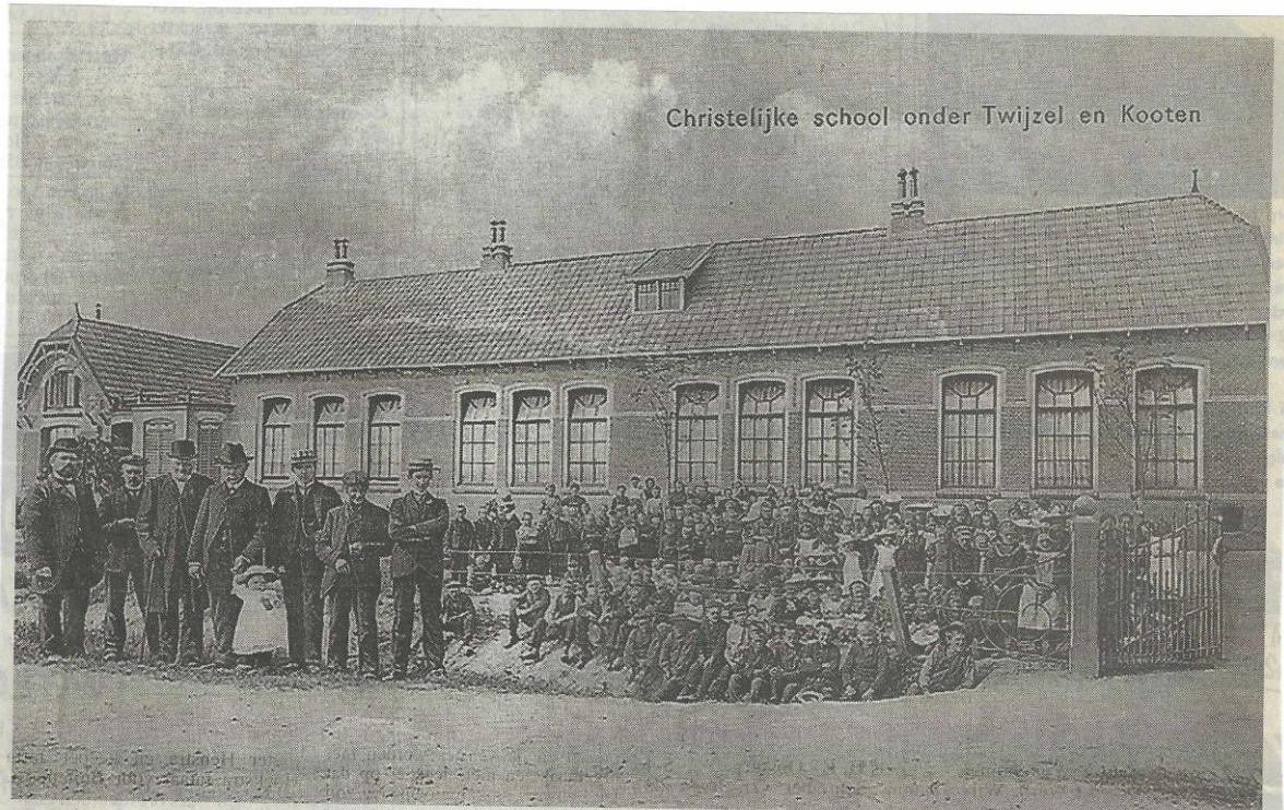
Ansichtkaart van omstreeks 1905 van de voormalige chr. school te Twijzelerheide. Dit schoolgebouw stond, volgens mededeling van mevrouw Van der Bij te Twijzel, aan de Bjirkewei, ongeveer op de huidige locatie van het museum.